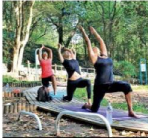
Los parques turísticos como Chipinque (foto) permitirá un aforo del 50% de su capacidad para la realización de actividades deportivas

En amarillo se ubica la tasa de transmisión que bajó de 1.32 a 1.23; y en verde se mantienen la capacidad instalada de pruebas diarias; la comparación de enfermedades respiratorias y